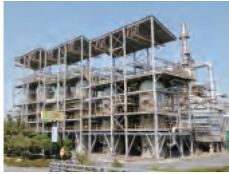
クライアント: エス・オイル 設備名: 減圧残渣油脱硫設備 57,000 BPSD 建設サイト: 韓国 ウルサン