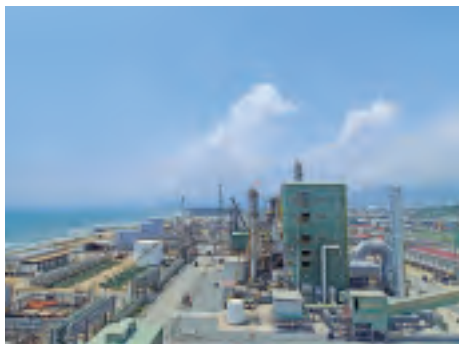
クライアント: ペネズエラ石油化学会社 設備名: 尿素製造設備 2,200 t/d 建設サイト: ペネズエラ モロン