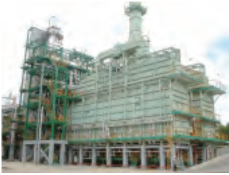
クライアント: スラブネフテ・ヤロスラブリ石油精製会社 設備名: 重質油熱分解(ビスプレーカー)設備 28,000 BPSD 建設サイト: ロシア ヤロスラブリ