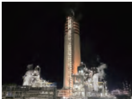
クライアント: チャンバル・ファーティライザーズ 設備名: アンモニア・尿素製造設備 アンモニア 2,200 t/d 尿素 4,000 t/d 建設サイト: インド ラジャスタン州 コタ